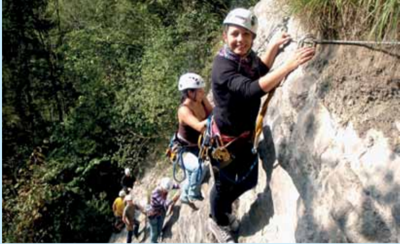
Im Team erklimmt der Lehrlingsnachwuchs der Vorarlberger Sparkassen jeden Berg.

Ein guter Einstieg ins Berufsleben motiviert ganz besonders. Deshalb gestalteten die Vorarlberger Sparkassen für ihre Lehreinsteiger erstmals ein spezielles Event. Anfang September fand im high5-Outdoorcenter in Lingenau ein Kick-off für die Bankeinsteiger statt: Insgesamt acht Lehrlinge und drei Ausbilder erledigten herausfordernde Aufgaben und stärkten gleichzeitig den Teamgeist.