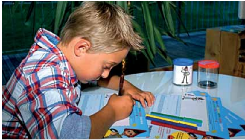
Damit Kinder noch lieber ihren verheißungsvoll klimpernden Schatz hüten und mehren, dürfen sie in den Vorarlberger Sparkassen ihre eigene Sparbüchse gestalten. Malvorlagen können unter www.sparkasse.at/vorarlberg aus dem Internet heruntergeladen werden. Kinder, die ihre Zeichnungen bis zum Weltspartag in ihre Sparkasse bringen, nehmen an einem Preisausschreiben teil.

der Sparstrumpfsparer ein Zeichen, dass „das Vertrauen in die Banken nicht ganz so schlecht ist“. Das gilt besonders für jene Banksektoren, die aufgrund ihres Geschäftsmodells dem finanziellen Transaktionsprozess verpflichtet sind.