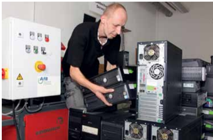
Österreichweit sollen in den nächsten Jahren über 20.000 Geräte der Sparkassengruppe in den Aufbereitungskreislauf kommen.

Die Sparkassengruppe und AfB – Arbeit für Menschen mit Behinderungen – setzen neue Maßstäbe in der nachhaltigen Verwertung von IT-Hardware. Ausrangierte PC, Bildschirme, Notebooks etc. werden nun nach Ablauf der Leasingverträge vom Leasingpartner der Sparkassengruppe an die AfB übergeben. Die Firma AfB holt die Ware ab, testet, reinigt und – falls nötig – repariert sie, löscht final die vorhandenen Daten und verkauft die Geräte wieder. Damit wird die Umwelt entlastet und gleichzeitig Menschen mit Beeinträchtigungen Arbeit verschafft. Mehr dazu auf www.afb24.at.