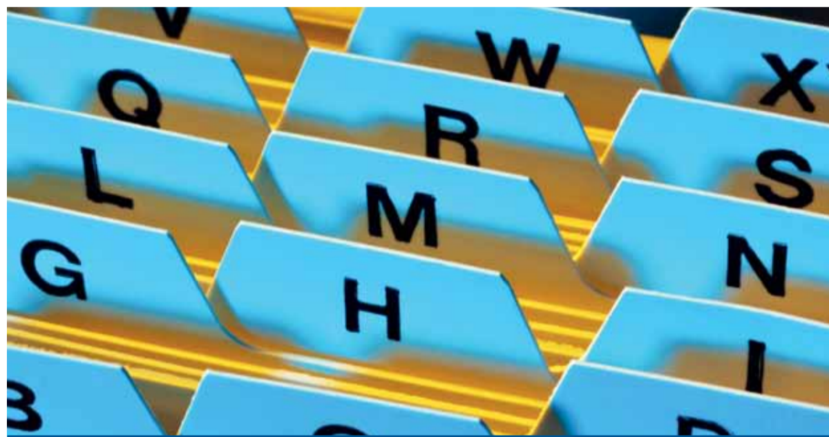
Aus dem ‚Zettelkasten‘ der Bankenbeschimpfung das Richtige verwenden.

Unter dem Seitentitel „Achterbahn“ wollen wir einen Schuss Humor, einen halbernst-satirischen Blick auf Aktuelles und eine zusätzliche Portion pointierter Meinung ins hochseriöse Redaktionsprogramm rühren. Zum thematischen Schaukeln und gelegentlichen Verschaukeln. Sparefroh ist jedenfalls angeschnallt. Hier kann er zeigen, dass er auch Humor hat.