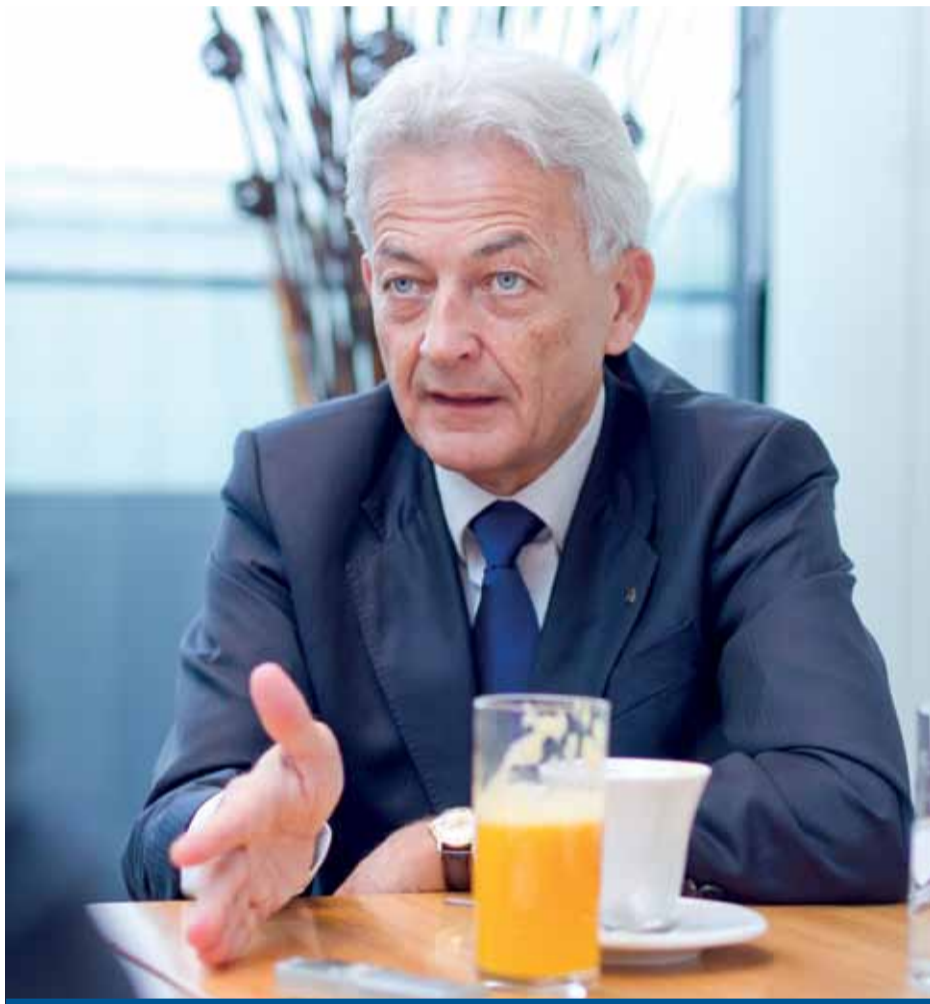
„Die Politik muss endlich klar zwischen unserem Geschäftsmodell und den Zockern unterscheiden.“