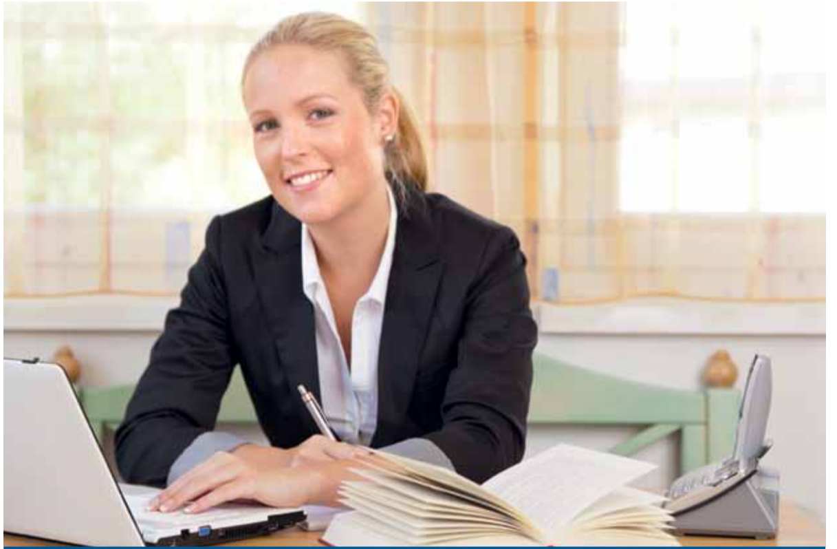
Studien zeigen: Frauen in Führungsgremien verbessern die Ergebnisse.

Eine Untersuchung bei den 290 größten börsennotierten Unternehmen Europas ergab vor kurzem, dass sich Unternehmen mit weiblichen Vorstandsmitgliedern im Zeitraum von 2005 bis 2010 bei allen betrieblichen Kennzahlen besser entwickelt haben als Unternehmen ohne weibliche Vorstandsmitglieder. Gemischte Führungsteams arbeiten besser zusammen, und Unternehmen mit Frauen in Top-Positionen haben bessere Betriebsergebnisse. Eine Chance – auch für die Sparkassenwelt.