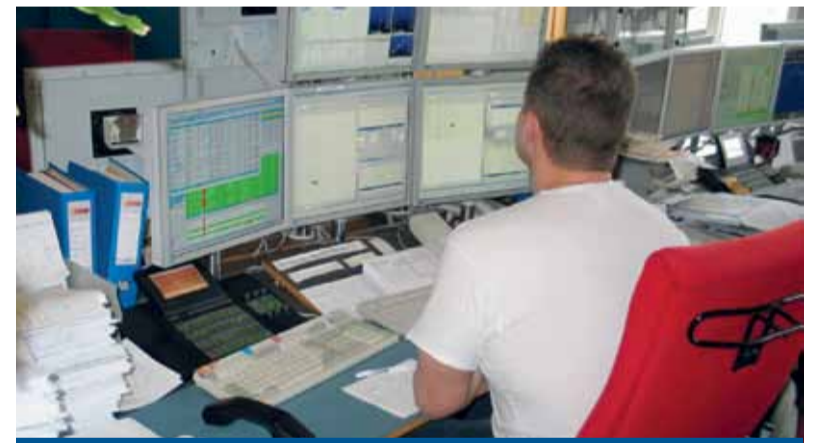
„Finanztransaktionssteuer darf nicht kleine Aktionäre treffen.“

Speed-Transaktionen, bei denen Milliarden von Dollar und Euro in Sekundenschnelle Tag für Tag rund um den Erdball gejagt werden, eindämmen. Wichtig wäre es also, die außerbörslichen, hochspekulativen Transaktionen zu erfassen. Also etwa die Hedge-Spread-Aktionen der Finanzjongleure.