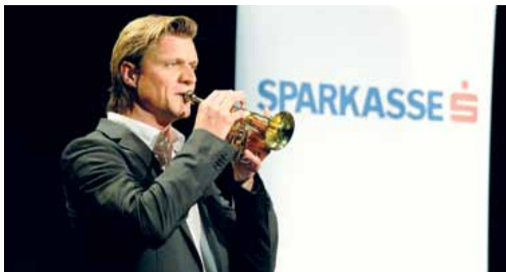
Gery Seidl begeistert Kunden der Kärntner Sparkasse und der s Versicherung im Casineum Velden.

s Versicherung, Erste Bank und Sparkassen schicken Gery Seidl, den Star der neuen, jungen Kabarettzene, auf Österreich-Tour. Im Rahmen seines aktuellen Tour-Programms „Total spezial“ bringt der Ausnahmekabarettist eine Auswahl aus seinen bisherigen Werken. Bis Jahresende wird die Sparkassen-Kabaretttour 2012 in mehr als 60 Veranstaltungen österreichweit rund 25.000 Kunden begeistern.