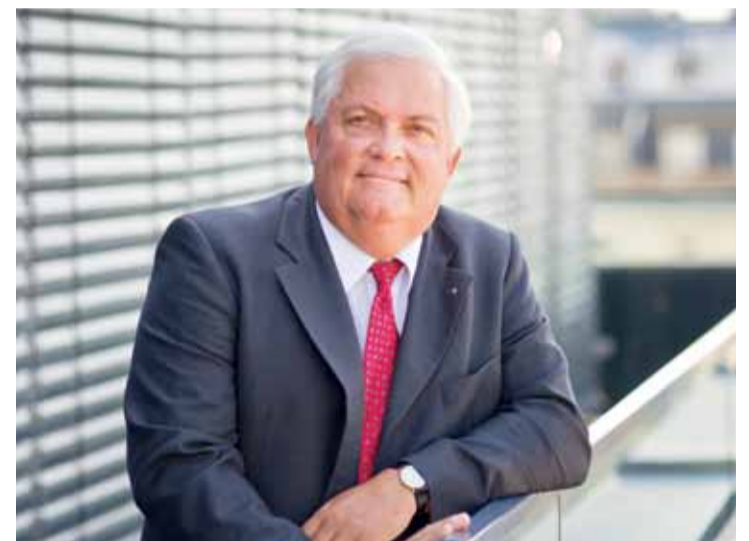
Christian Aichinger, Präsident des Österreichischen Sparkassenverbandes

Die Vize-Präsidenten der Europäischen Sparkassenvereinigung (ESV) handeln als Schlüsselfiguren, indem sie auf europäischer Ebene das der Realwirtschaft dienende Geschäftsmodell der Sparkassen vertreten und die Stärke der regional verankerten Banken vermitteln.