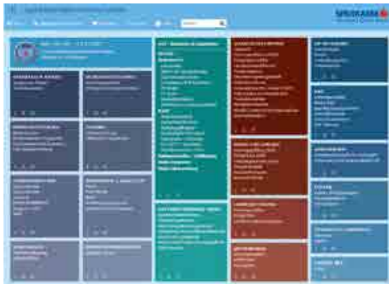
Im Vorjahr verzeichnete das SIS 1.306 aktive UserInnen, von denen 270.976 Auswertungen abgerufen wurden.

Der Name Sparkassen-Informationen-System sagt bereits vieles, doch nicht alles: Hinter dem Kürzel SIS steht viel technisches Know-how und ein Team, das dank langjähriger Erfahrung viel Verständnis für die Bedürfnisse der MitarbeiterInnen in den Sparkassen mitbringt.