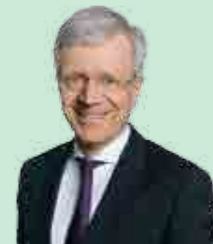
GERHARD FABISCH, PRÄSIDENT DES SPARKASSENVERBANDES

Gerhard Fabisch Präsident des Österreichischen Sparkassenverbandes