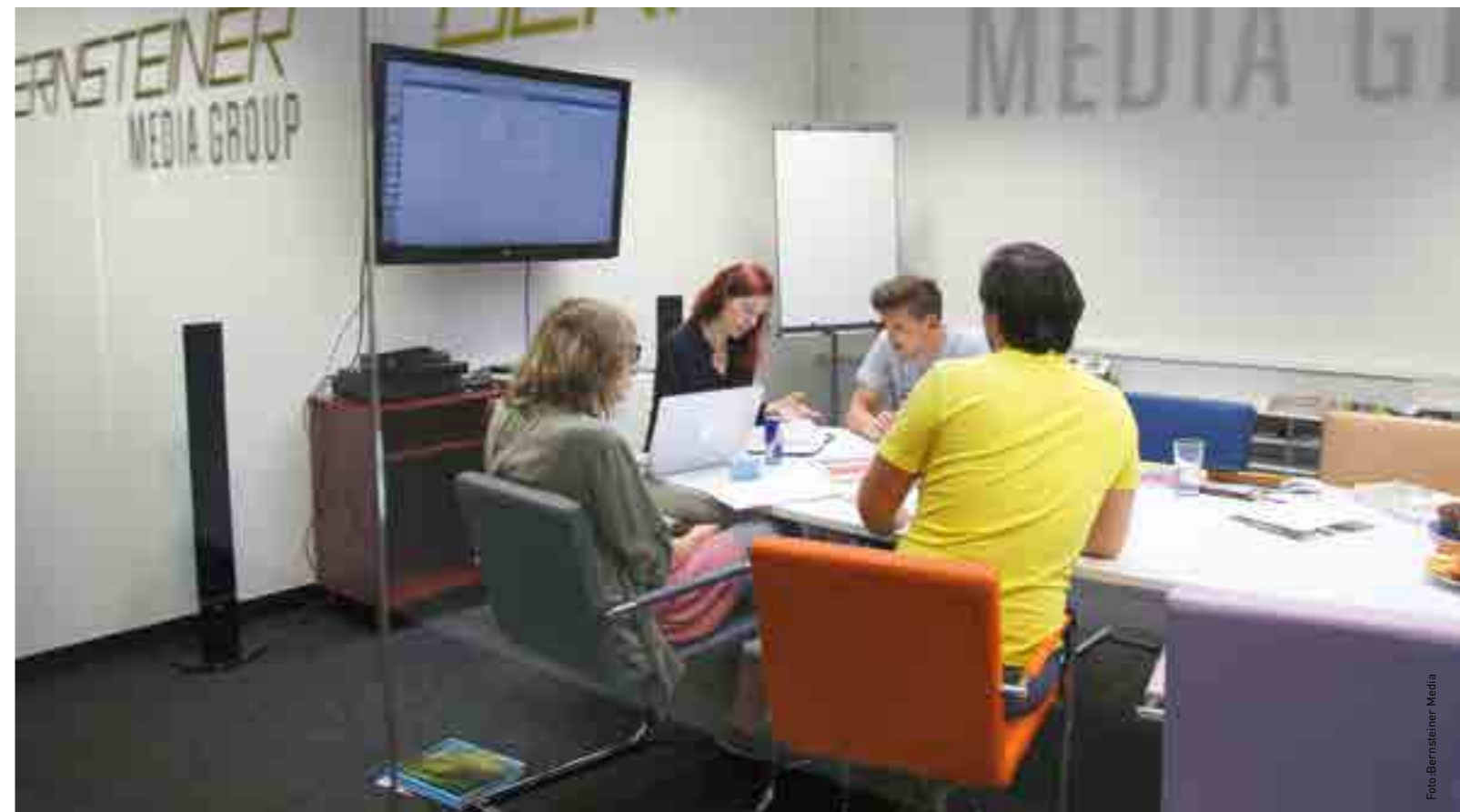
Digitalisierung und innovative Projekte kennzeichnen die Zukunft der Familienunternehmen, die sich mit jedem Generationenwechsel neu erfinden. Eine Stärke, die diese Unternehmen auszeichnet.